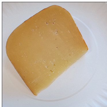
„Pan Trufla” ser dojrzewający z truflą