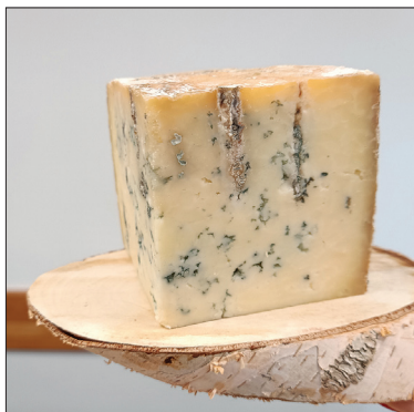
„Hilton ser pleśniowy”