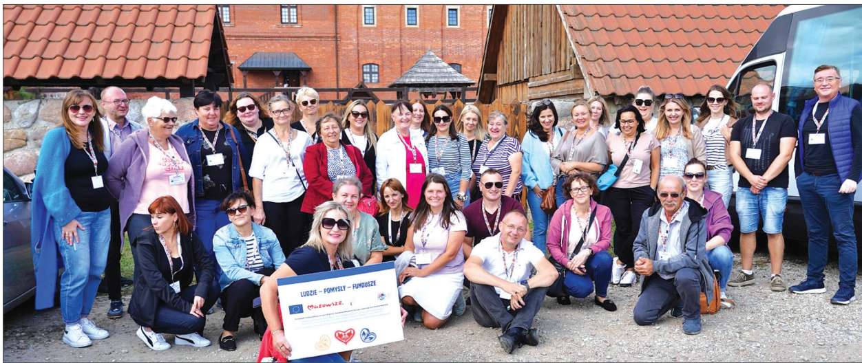
Laureaci i uczestnicy konkursów KSOW z wizytą na Podlasiu.

W dniach 25-27 września 2024 r. laureaci i uczestnicy konkursów Krajowej Sieci Obszarów wiejskich (KSOW) oraz przedstawiciele samorządów uczestniczyli w wizycie studyjnej do województwa podlaskiego w poszukiwaniu wiedzy, dobrych praktyk i ciekawych pomysłów.