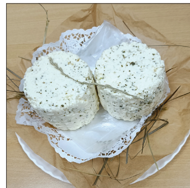
Ser podpuszczkowy z trawą żubrówką”

Znamy wyniki VIII edycji Mazowieckiego Konkursu Serów Zagrodowych. Do tegorocznej zakwalifikowano 32 sery, wytwarzane przez mazowieckich producentów. Kapituła konkursu wyłoniła laureatów i wskazała wyróżnionych w czterech kategoriach: sery świeże, sery dojrzewające, sery pleśniowe, sery kwasowe.