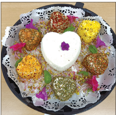
„Twarożki w ziołowych posypkach”