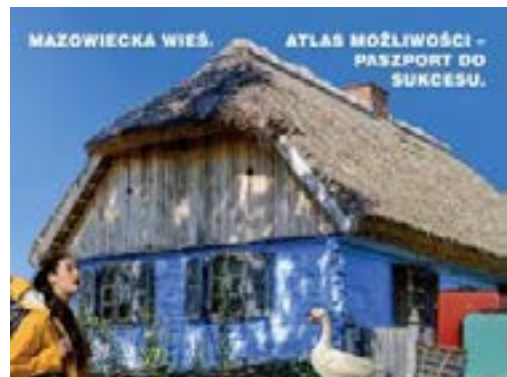
Okładka publikacji „Mazowiecka Wieś. Atlas możliwości – paszport do sukcesu”

Agroturystyka propaguje wartości i kulturę terenów wiejskich. Tworzy również świadomość odpowiedzialności za środowisko i zamieszkiwany obszar. Jednocześnie buduje poczucie wspólnoty i tożsamości lokalnej. Uczucie przynależności jest kluczowe dla chęci pozostania na wsi oraz zaangażowania w rozwój zamieszkiwanej okolicy. Jednocześnie, tworząc nowe miejsca pracy i możliwości dodatkowego zarobkowania agroturystyka daje lokalnej społeczności możliwość utrzymania się i zapobiega ucieczce do miast w poszukiwaniu pracy. Tym samym zmniejsza się wyludnianie terenów wiejskich.