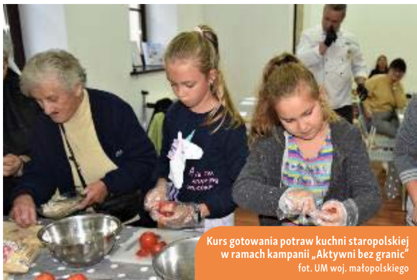
Kurs gotowania potraw kuchni staropolskiej w ramach kampanii „Aktywni bez granic”