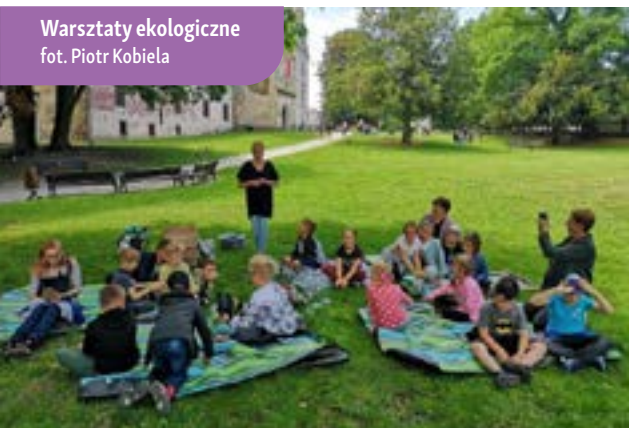
Warsztaty ekologiczne

Projekt był przeznaczony dla dzieci klas I – III szkoły podstawowej. Jego celem było propagowanie wiedzy ekologicznej poprzez jednoczesną promocję obszarów wiejskich województwa opolskiego i pokazanie ich potencjału turystycznego, a także kulturowego dziedzictwa.