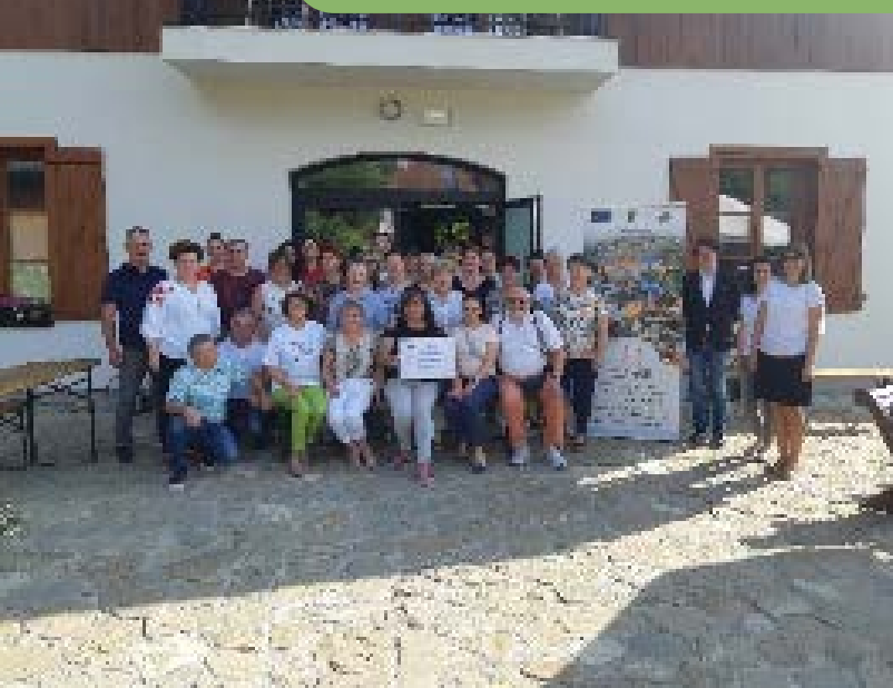
Uczestnicy wyjazdu studyjnego w Zagrodzie w Pacanach

smaku i wartości odżywczych. Dodatkowo, wspierając lokalnych dostawców, budujemy zapotrzebowanie na konkretne towary i wspieramy rynek w regionie.