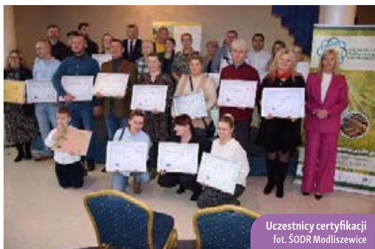
Uczestnicy certyfikacji

Podczas szkolenia, uczestnicy oprócz nowej wiedzy, mogli również wymienić się swoimi doświadczeniami i nawiązać kontakty biznesowe.