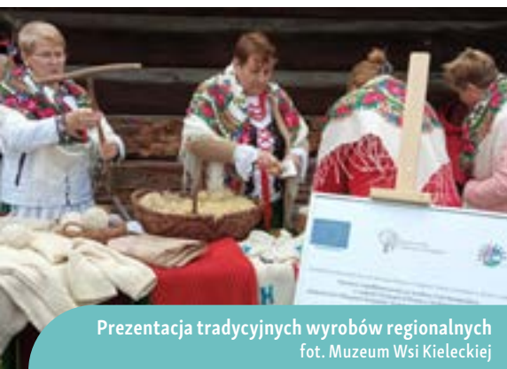
Prezentacja tradycyjnych wyrobów regionalnych