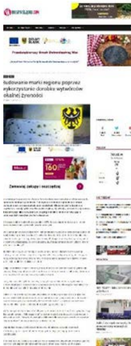
Banner Informacyjno-promocyjny Autor: Małgorzata Molenda Grafika dotycząca artykułu „Budowanie marki regionu poprzez wykorzystanie dorobku wytwórców lokalnej żywności” Autor: Karolina Brzemkowska