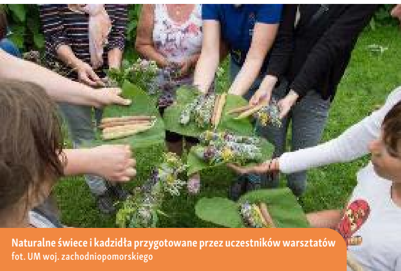
Naturalne świece i kadzidła przygotowane przez uczestników warsztatów

Do prowadzenia warsztatów w ramach projektu zaproszono osoby, które od lat z zaangażowaniem i pasją pielęgnują regionalne tradycje. Dzięki ich zaangażowaniu uczestnicy projektu mieli okazję nie tylko poznać, lecz również praktycznie doświadczyć tradycji ludowych, rzemieślniczych oraz korzystania z naturalnych zasobów otaczającego środowiska. Takie oddolne inicjatywy mogą stanowić siłę napędową kształtującą kreatywność i przywiązanie lokalnej społeczności do tradycji w kolejnych latach.