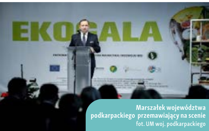
Marszałek województwa podkarpackiego przemawiający na scenie