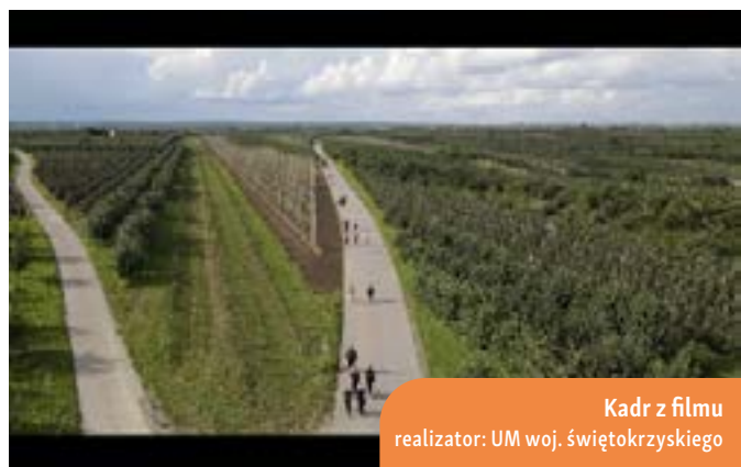
Kadr z filmu realizator: UM woj. świętokrzyskiego

Film ten nie tylko ukazał różnorodność i sukcesy kobiet z różnych części regionu, ale również stał się platformą do wymiany wiedzy i doświadczeń między tymi liderkami. Ich wspólną cechą jest przedsiębiorczość, kreatywność i pasja, która przyczynia się do osobistego rozwoju i w efekcie do rozwoju obszarów wiejskich. Osobiste przekazy wspomnianych kobiet, to historie, które mogą zainspirować i porwać do działania inne osoby żyjące w społeczności wiejskiej. Ponadto, dokument ten dostarczył cennej wiedzy na temat możliwości korzystania ze wsparcia oferowanego przez PROW, zwiększając zainteresowanie i świadomość na temat dostępnych środków.