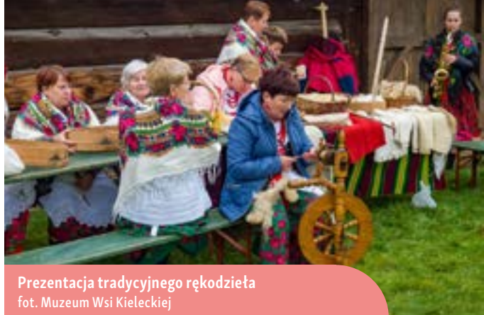
Prezentacja tradycyjnego rękodzieła

Na scenie wystąpiły również zespoły ludowe z regionu świętokrzyskiego, prezentując lokalne pieśni i przyśpiewki. Wydarzenie to nie ograniczało się jednak tylko do widowisk, ponieważ odbywały się także degustacje potraw, włączając w to pieczone ziemniaki nad ogniskiem oraz zupy przygotowywane z jesiennych owoców i warzyw. W chałupie ze Złotnik można było zobaczyć wypiek tradycyjnych podpłomyków w starym piecu. Ponadto, podczas imprezy odbywały się pokazy tradycyjnych rzemiosł, w tym kowalstwa, garncarstwa i tkactwa. Doświadczone animatorki prowadziły warsztaty, na których można było nauczyć się tworzenia jesiennych bukietów. W ramach wydarzenia odbywał się także kiermasz lokalnych produktów i potraw, gdzie swoje wyroby prezentowali członkowie sieci Dziedzictwo Kulinarne Świętokrzyskie, Gospodarstwa Agroturystyczne z regionu świętokrzyskiego, producenci regionalnej żywności, Koła Gospodyń Wiejskich oraz rękodzielnicy. Impreza ta stanowiła doskonałą okazję do eksplorowania i cieszenia się tradycyjnymi smakami oraz rzemiosłami charakterystycznymi dla regionu świętokrzyskiego.