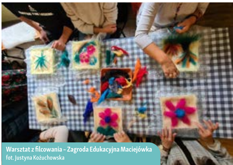
Warsztat z filcowania – Zagroda Edukacyjna Maciejówka

Celem całej inicjatywy było pokazanie uczestnikom możliwości edukacyjnych, jakie daje prowadzenie gospodarstwa rolnego. W programie warsztatów znalazło się także zapoznanie zainteresowanych z procesem zakładania zagrody edukacyjnej. Prowadzący zwrócili uwagę na szerokie spektrum aspektów edukacyjnych, jakie można wziąć pod uwagę przy planowaniu własnego przedsięwzięcia o takim charakterze.