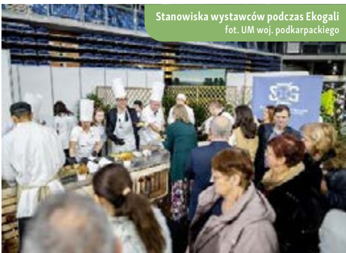
Stanowiska wystawców podczas Ekogali

Targi zostały zorganizowane w celu promocji wysokiej jakości produktów spożywczych, w tym ekologicznych i tych umieszczonych na liście Ministra Rolnictwa i Rozwoju Wsi. Jednocześnie miały na celu stworzenie możliwości sprzedaży zarówno na detalicznym, jak i hurtowym poziomie.