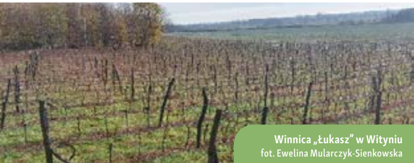
Winnica „Łukasz” w Wityniu