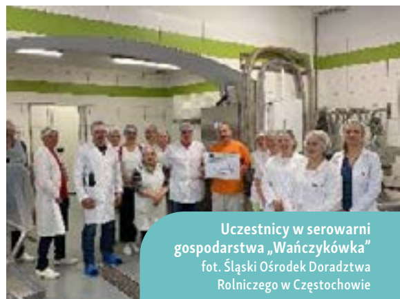
Uczestnicy w serowni gospodarstwa „Wańczykówka”

Uczestnicy mogli zdobytą wiedzę sprawdzić w praktyce, przygotowując różne próbki jogurtów. Zwieńczeniem było wprowadzenie uczestników w tajniki pielęgnacji i przechowywania serów oraz zakończenie i podsumowanie własnej produkcji sera feta. Dzień trzeci przeznaczono na podsumowanie nowej wiedzy i networking uczestników.