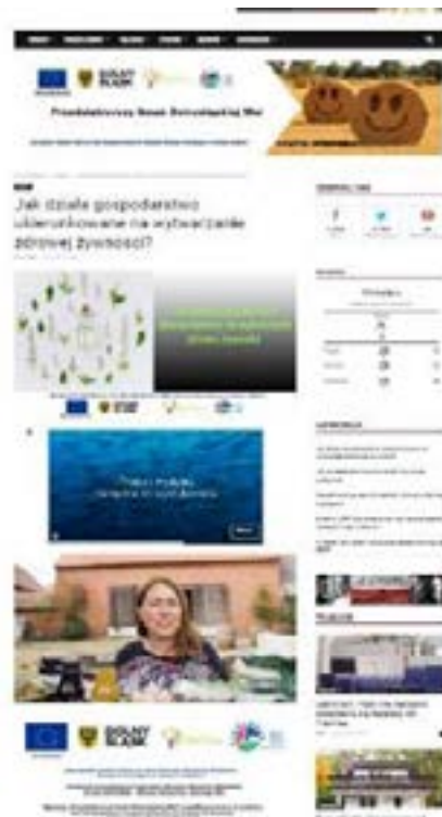
Banner informacyjno-promocyjny oraz grafiki na podstawie filmu Autor: Małgorzata Molenda Autor filmu: Piotr Polarski

Projekt miał na celu aktywne zaangażowanie różnych grup – od lokalnych mieszkańców po instytucje rządowe – w proces wdrażania inicjatyw służących rozwojowi obszarów wiejskich. Ważnym aspektem projektu było podnoszenie świadomości społecznej na temat obowiązującej polityki dotyczącej rozwoju obszarów wiejskich, jak również informowanie o dostępnych środkach wsparcia finansowego. Podjęcie takich kroków miało na celu lepsze wykorzystanie dostępnych zasobów i możliwości przez beneficjentów. Projekt skupił się na edukacji i informowaniu społeczeństwa na temat lokalnego rynku żywności. Kładziono nacisk na przedstawienie korzyści płynących z zakupów u lokalnych rolników, zrozumienie idei krótkiego łańcucha dostaw oraz strategii „od pola do stołu”. Projekt miał również pokazać, jak zakup produktów lokalnych