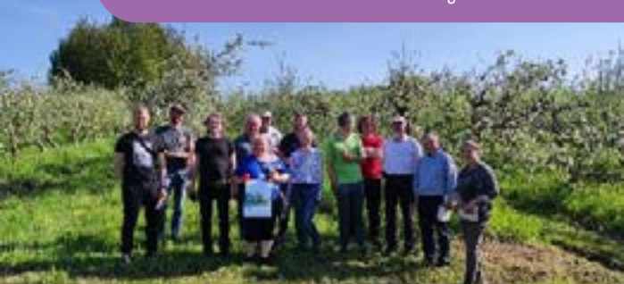
Uczestnicy warsztatów w sadzie z tradycyjnymi odmianami

Arboretum Uniwersytetu Wrocławskiego, czyli miejsce upraw drzew i krzewów w Wojstawicach pod Niemczą nie tylko prezentuje kolekcję starych odmian czereśni, ale także daje możliwość spróbowania owoców z kilkudziesięciu odmian tych drzew. Wystarczy, że odwiedzisz obiekt w sezonie! To unikalne miejsce łączy w sobie zarówno funkcje edukacyjne, jak i doświadczalne, dając możliwość bezpośredniego kontaktu z różnorodnością natury. Dodatkowo ogród stanowi swoistą przystań botaniczną, chroniąc wiele rzadkich, zagrożonych i ginących gatunków drzew oraz krzewów, co czyni go nie tylko atrakcją turystyczną, ale i ważnym centrum ochrony bioróżnorodności. Z kolei Pałac w Kamieńcu Ząbkowickim, oprócz swojej imponującej architektury, kryje również historię związaną z królową niderlandzką Marianną Orańską, która była jego właścicielką. Wyróżnikiem tego miejsca jest ogrodowa kolekcja starych odmian jabłoni, wśród których znajduje się odmiana „Książę Albert Pruski”.