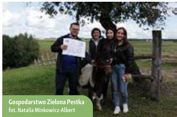
Gospodarstwo Zielona Pestka

Rolnictwo opiekuńcze – jest formą działalności kierowaną do rolników, którzy szukają nowych źródeł dochodu i jednocześnie wykazują gotowość do pomocy osobom znajdującym się w trudnej sytuacji życiowej.