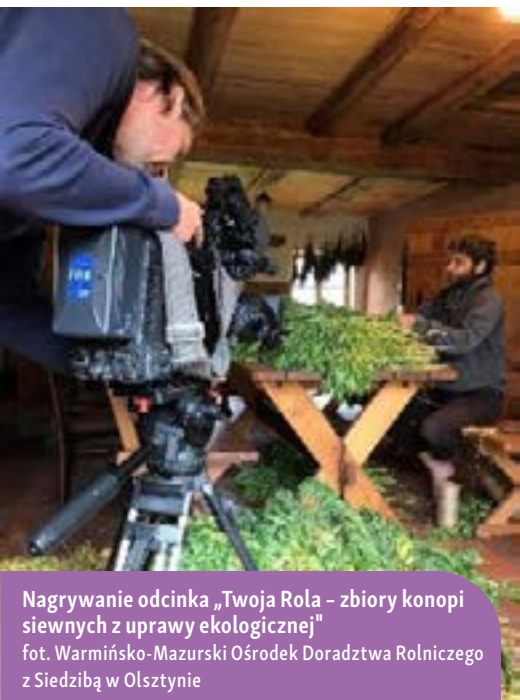
Nagrywanie odcinka „Twoja Rola – zbiory konopi siewnych z uprawy ekologicznej”