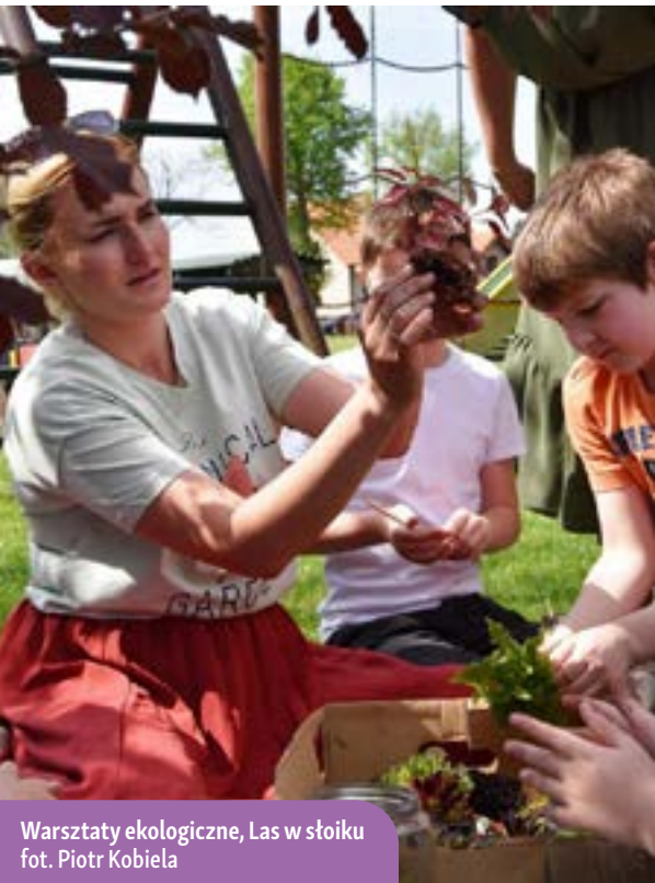
Warsztaty ekologiczne, Las w słoiku