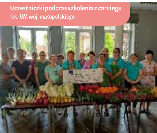
Uczestniczki podczas szkolenia z carvingu

Od dawna wiadomo, że jemy nie tylko ustami, ale też oczami. Estetyka pożywienia odgrywa dużą rolę w gastronomii, ale też m.in. w turystyce. Jedną z metod dekorowania potraw jest carving – sztuka rzeźbienia w owocach i warzywach, która była przedmiotem warsztatów zorganizowanych przez Stowarzyszenie Lokalna Grupa Działania Turystyczna Podkova. Zadaniem przeprowadzonej operacji było zwiększenie wiedzy i zdolności uczestników w obszarze tworzenia dekoracji z owoców i warzyw przez zorganizowanie szeregu warsztatów. Działanie to miało także na celu wyrównanie możliwości i wykorzystanie potencjału kobiet we wspieraniu lokalnego rozwoju, jak również zachęcenie uczestników do poszukiwania dodatkowych sposobów na zarobek poza rolnictwem z wykorzystaniem nabytej podczas warsztatów wiedzy i umiejętności.