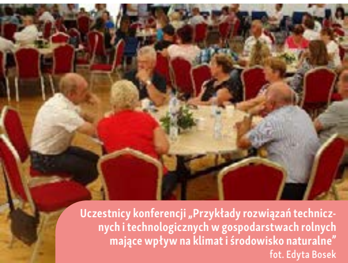
Uczestnicy konferencji „Przykłady rozwiązań technicznych i technologicznych w gospodarstwach rolnych mające wpływ na klimat i środowisko naturalne”

Pokazując te projekty, wysłano przekonujący przekaz o pozytywnym wpływie nowoczesnych rozwiązań na środowisko i klimat. Dzięki temu udało się zwiększyć świadomość uczestników w tych kwestiach i rozpowszechnić wiedzę na temat prowadzenia działalności rolniczej przy minimalnym wpływie na lokalne środowisko naturalne i klimat.