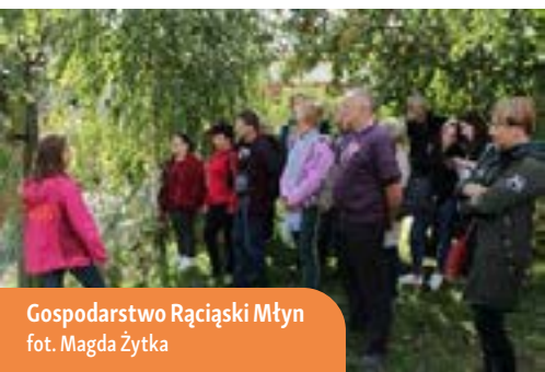
Gospodarstwo Rąciąski Młyn

W miejscowości Bochlin, w gospodarstwie Toskania Kociewska, na terenie podwórza znajduje się amerykańska ciężarówka, która oferuje miejsca noclegowe dla pięciu osób. Pojazd ten jest w pełni wyposażony i udostępni gościom łazienkę oraz kuchnię utrzymaną w stylu lat 70-tych.