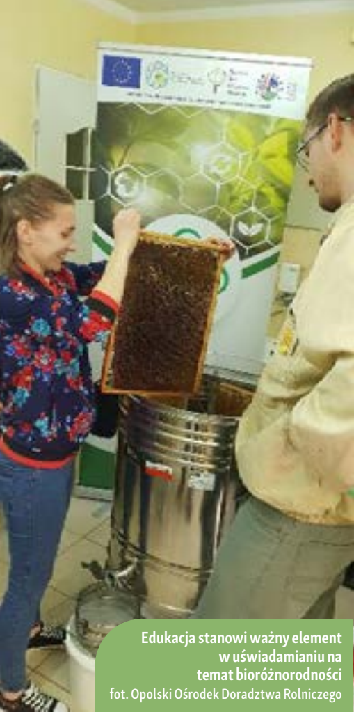
Edukacja stanowi ważny element w uświadamianiu na temat bioróżnorodności

i hobbystycznie, o różnej skali produkcji, działających na terenie województwa opolskiego. Ponadto, broszura kierowana jest do osób zainteresowanych tematyką pszczelarską, członków kół pszczelarskich, doradców rolnych oraz wszystkich, którzy chcieliby poszerzyć swoją wiedzę na ten temat.