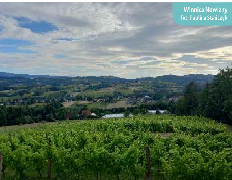
Winnica Nowizny

Inicjatywa pokazywała skuteczne praktyki z zakresu promocji produktu lokalnego, kultury regionalnej, turystyki, tworzenia marki własnej oraz przedsiębiorczości na obszarach wiejskich, opierając się na wykorzystaniu lokalnych zasobów.