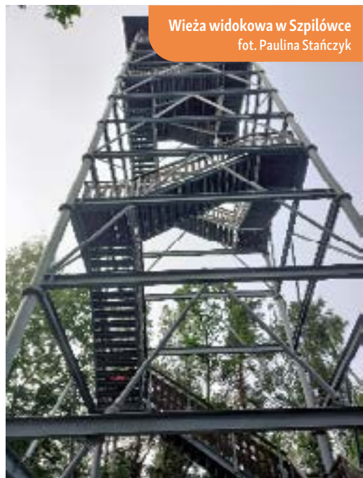
Wieża widokowa w Szpilówce

Liczna grupa mieszkańców obszaru Lokalnej Grupy Działania „Podkowa i Lokalnej Grupy Działania „Przymierze Jeziorsko” uczestniczyła w fascynującym wyjeździe studyjnym na terenie lokalnej grupy działania „Na Śliwkowym Szlaku”. Przyjemność zwiedzania gościnnej Małopolski