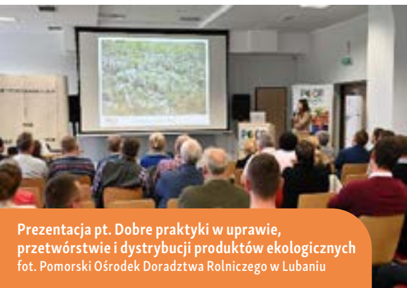
Prezentacja pt. Dobre praktyki w uprawie, przetwórstwie i dystrybucji produktów ekologicznych

przez Dyrektora Pomorskiego Ośrodka Doradztwa Rolniczego w Lubaniu. W efekcie, wyłoniono laureatów z województwa pomorskiego, którzy zakwalifikowali się do drugiego – krajowego etapu konkursu.