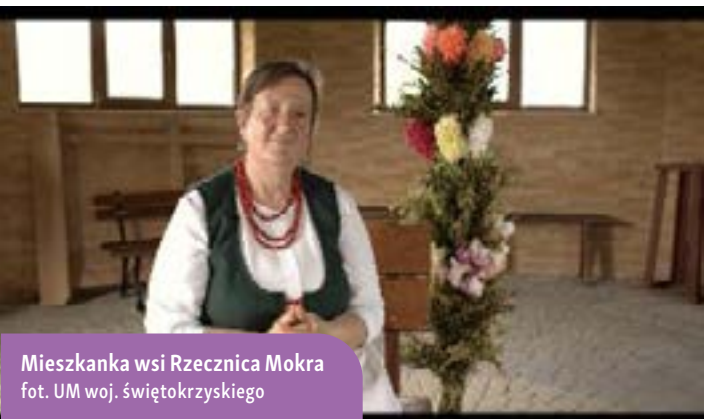
Mieszkanca wsi Rzecznica Mokra

wiejskich. Film był skierowany do innych mieszkanków obszarów wiejskich, które jeszcze nie skorzystały z programu PROW, a które chciałyby skorzystać z szansy na rozwinięcie skrzydeł w swoich działalnościach.