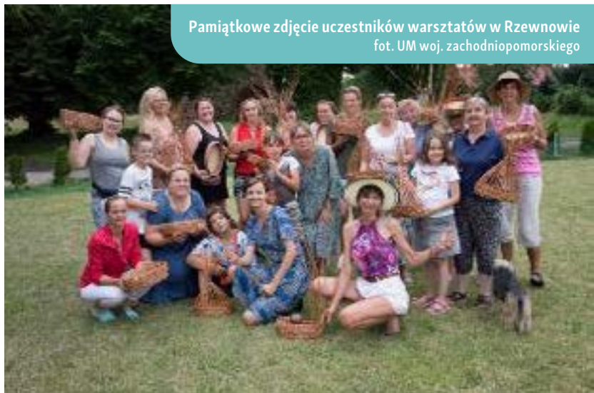
Pamiętkowe zdjęcie uczestników warsztatów w Rzewnowie

Wzmacnianie więzi międzyludzkich i międzypokoleniowych poprzez korzystanie z bogactwa dziedzictwa kulturowego to klucz do budowania silnej społeczności, gotowej do kontynuowania i rozwijania wartości przekazywanych z pokolenia na pokolenie.