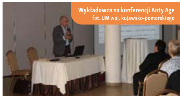
Wykładowca na konferencji Anty Age

W kolejnej prezentacji, zatytułowanej „ Właściwości zdrowotne starych gatunków zbóż ”, omówiono korzyści zdrowotne takich pszenic jak samopsza, płaskurka i orkisz. W ramach konferencji odbył się również wykład na temat wpływu żywności