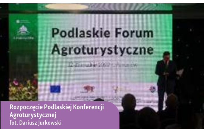
Rozpoczęcie Podlaskiej Konferencji Agroturystycznej

Celem projektu było rozpowszechnienie w województwie podlaskim skutecznych metod i dobrych praktyk, które są korzystne dla promowania przetwórstwa realizowanego w ramach krótkiego łańcucha dystrybucji. Dodatkowo, operacja ta miała na celu aktywną promocję lokalnych i regionalnych produktów, podkreślając ich unikalność oraz wartość dla lokalnej społeczności i gospodarki.