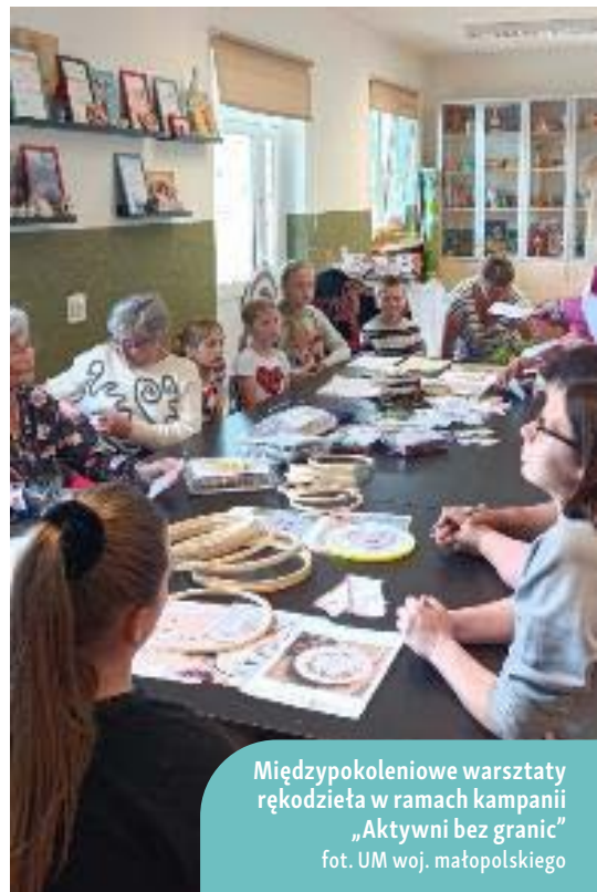
Międzypokoleniowe warsztaty rękodzieła w ramach kampanii „Aktywni bez granic”

Zorganizowane w ramach projektu warsztaty przyciągnęły 50 uczestników. Była to liczba zakładana na etapie planowania przedsięwzięcia. Realizowany program obejmował spotkania warsztatowe dla wyżej wymienionych grup społecznych, a przy tym zainicjowanie tworzenia inspirujących miejsc pracy na obszarach wiejskich. Dzięki programowi „Aktywni bez granic” udało się wykreować przestrzeń, w której różnorodne grupy społeczne mogły wspólnie pracować nad rozwojem swoich obszarów wiejskich i planować lepszą przyszłość.