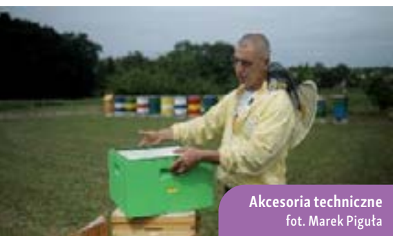
Aksesoria techniczne fot. Marek Pięguła

Rok Pasieczny – rok pasieczny to okres związany z hodowlą pszczół, który zazwyczaj obejmuje okres od przygotowania pszczół do zimowania, czyli sierpień-wrzesień w jednym roku kalendarzowym do sierpnia-wrzesnia roku następnego. To kluczowy czas w cyklu życia pasieki, gdzie pszczelarze przygotowują swoje rodziny pszczele do zimowania i dbają o ich kondycję.