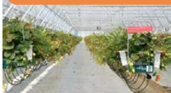
Plantacja truskawek w miejscowości Czechy k. Krakowa

Uczestnicy wyjazdu byli bardzo zadowoleni z możliwości zapoznania się z nowoczesnymi systemami uprawy, co przejawiało się w wysokich ocenach programu. W dalszym etapie projektu oczekuje się, że jego rezultatem będzie zastosowanie innowacyjnych rozwiązań przez producentów w ich własnych gospodarstwach, a co za tym idzie, zwiększenie konkurencyjności i rentowności sektora truskawek w woj. świętokrzyskim.