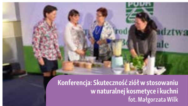
Konferencja: Skuteczność ziół w stosowaniu w naturalnej kosmetyce i kuchni

Podkreślano szczególne znaczenie ziół zarówno w perspektywie historycznej, jak i tej przyszłościowej – pokazując, jak zielarstwo może wpłynąć na rozwój i promocję obszarów wiejskich. Konferencja odbywała się hybrydowo. W Podkarpackim