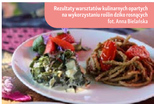
Rezultaty warsztatów kulinarnych opartych na wykorzystaniu roślin dziko rosnących