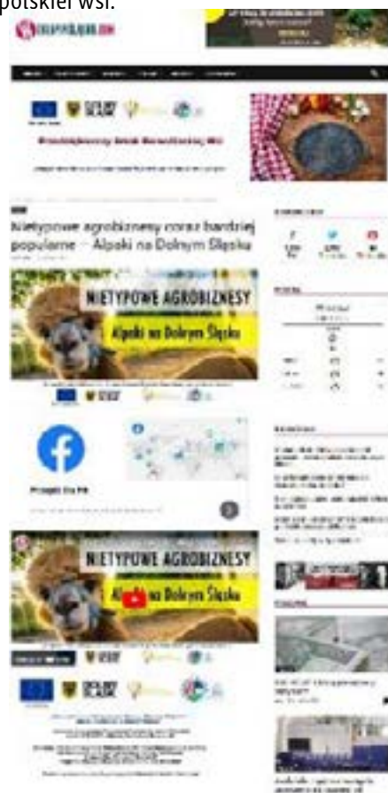
Banner informacyjno-promocyjny na górze strony Autor: Małgorzata Molenda

- instytucja ta powstała z połączenia Agencji Rynku Rolnego i Agencji Nieruchomości Rolnych. Jej główne zadania to zarządzanie nieruchomościami rolnymi należącymi do Skarbu Państwa (w tym sprzedaż i dzierżawa, nieodpłatne przekazywanie gruntów oraz bezzwrotna pomoc finansowa). KOWR odpowiada również za nadzór nad spółkami istotnymi dla gospodarki narodowej, wydawanie decyzji w zakresie prywatnego obrotu ziemią, promocję polskich produktów rolno-spożywczych zarówno w kraju, jak i za granicą, a także za opracowywanie i rozpowszechnianie informacji, związanych z realizacją aktywnej polityki rolnej.