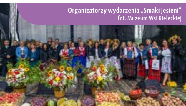
Organizatorzy wydarzenia „Smaki Jesieni”

Tradycje wiejskie kształtowały się przez wiele pokoleń, tworząc bogate dziedzictwo kulturowe. Niezmiennie fascynują i budzą zainteresowanie nie tylko osób wywodzących się z danego regionu, ale i wśród turystów, którzy pragną odkryć unikalne aspekty życia i kultury wiejskiej. Zachowanie tych tradycji pomaga nam nie tylko zrozumieć, jakie było życie naszych przodków, ale także jak te doświadczenia wpłynęły na nasze współczesne społeczności lokalne. Projekt pt. „Wskrzeszenie dawnych zwyczajów wsi świętokrzyskiej – pokazy obrzędowe i regionalna muzyka ludowa” przysłużył się temu ważnemu celowi.