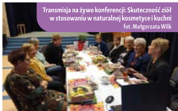
Transmisja na żywo konferencji: Skuteczność ziół w stosowaniu w naturalnej kosmetyce i kuchni

Świadomość tego, że mamy na wyciągnięcie ręki produkty nie tylko zdrowe, ale i takie, które mogą przyczynić się do wzmocnienia lokalnej marki, może znacznie pomóc w rozwoju gospodarstw rolnych i agroturystycznych. Wymagania konsumentów rosną i przesuwają się w stronę żywności ekologicznej, zdrowej, uprawianej zgodnie z najwyższymi standardami. Zielarstwo jest odpowiedzią na te potrzeby. Ma zastosowanie nie tylko w gastronomii – choć nadaje potrawom niepowtarzalnego smaku i charakteru, nie sposób nie wspomnieć też o walorach zdrowotnych ziół i ich wykorzystaniu w medycynie czy kosmetyce.