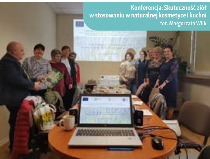
Konferencja: Skuteczność ziół w stosowaniu w naturalnej kosmetyce i kuchni