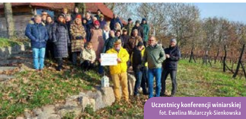
Uczestnicy konferencji winiarskiej

Rozwój sektora winiarskiego to nie tylko sztuka tworzenia wybornych win, ale także proces ciągłego doskonalenia i dostosowywania się do zmieniających się warunków i wymagań rynku. Dlatego też, w kontekście dzisiejszych wyzwań rolniczych i spożywczych, zgłębienie najnowszych rozwiązań w produkcji, ochronie i pielęgnacji winorośli ma kluczowe znaczenie. III Konferencja Winiarska pt. „Innowacje w uprawie,