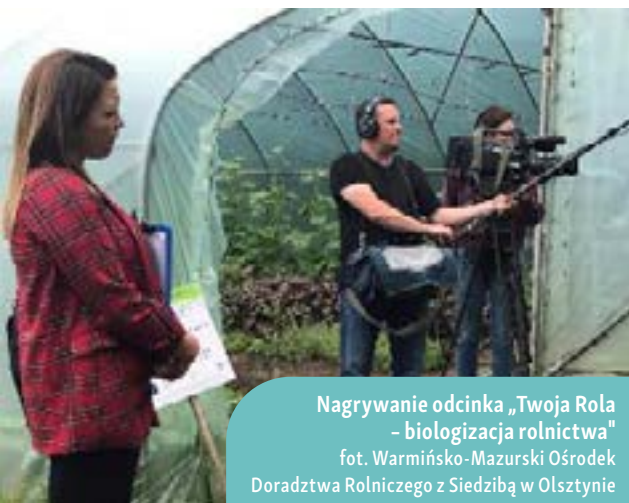
Nagrywanie odcinka „Twoja Rola - biologizacja rolnictwa”

inkubatorem jest przedsiębiorstwo, które udostępnia odpowiednią infrastrukturę lokalnym producentom rolnym i przetwórcom, aby ci mogli przerobić swoje produkty rolne.