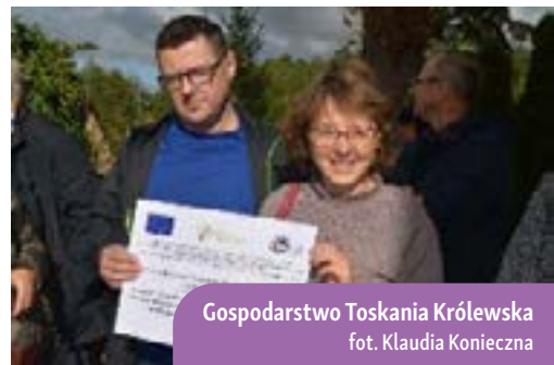
Gospodarstwo Toskania Królewska