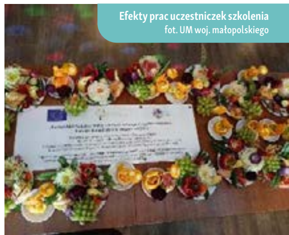
Efekty prac uczestniczek szkolenia

Dodatkową wartością były kontakty nawiązane między uczestnikami a partnerami projektu, co stworzyło możliwość dalszej współpracy przy przyszłych projektach. Partner KSOW, realizując projekt ponownie, dostrzegł ogromny potencjał w lokalnej społeczności i znaczenie integracji społeczności lokalnej.