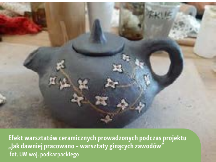
Efekt warsztatów ceramicznych prowadzonych podczas projektu „Jak dawniej pracowano – warsztaty ginących zawodów”

Warsztaty z tkactwa trwały łącznie 10 godzin, podzielone na dwie sesje po 5 godzin każda. Uczestnicy zapoznali się z tkactwem, jednym z najstarszych rzemioł na Podkarpaciu. Zaczęli od teoretycznego wprowadzenia do świata tkactwa, a następnie praktycznie nauczyli się przygotowywać ramę do tkania, manipulować osnową i dodawać nietypowe elementy dekoracyjne do gobelinu, korzystając z kolorowych nici i sznurków.