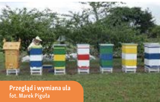
Przegląd i wymiana ula

ulepszenie praktyk hodowlanych i produkcyjnych, ale również przyczynienie się do zrównoważonego rozwoju rolnictwa, leśnictwa i obszarów wiejskich. Innym ważnym aspektem było zwiększenie atrakcyjności pszczelarstwa jako zawodu, co mogłoby przyczynić się do ograniczenia odpływu ludności z terenów wiejskich oraz wzmocnienia pozycji demograficznej tych obszarów. Projekt miał na celu nie tylko bezpośrednie wsparcie dla pszczelarzy, ale również szeroko zakrojone działania edukacyjne i promocyjne, mające na celu zwiększenie świadomości społecznej i rozwoju sektora pszczelarstwa jako ważnego elementu ekosystemu rolniczego i środowiska naturalnego.