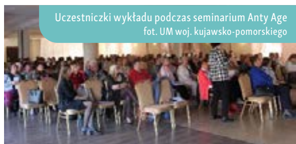
Uczestniczki wykładu podczas seminarium Anty Age

Tematyka konferencji koncentrowała się na zagadnieniach związanych z uprawą, hodowlą, przetwarzaniem oraz konserwacją produktów rolnych. Rozpoczęcie cyklu specjalistycznych prelekcji nastąpiło od wykładu pt. „ Zdrowie człowieka kiełkuje w glebie ”, podczas którego prelegent podkreślił, że po II wojnie światowej rolnictwo w Polsce zaczęło wykorzystywać sztuczne nawozy i chemiczne środki ochrony roślin. Zaznaczył, że doprowadziło to do nadmiernej chemizacji rolnictwa i jego przekształcenia w kierunku produkcji masowej na dużą skalę. Drugi wykład, zatytułowany „ Żywność ekologiczna poprawia jakość i długość życia ”, podkreślał znaczenie metod produkcji rolniczej dla jakości plonów. Badania naukowe potwierdzają, że konsumpcja żywności ekologicznej przyczynia się do obniżenia ryzyka wystąpienia chorób nowotworowych, nadwagi, otyłości, a także zaburzeń metabolicznych i chorób