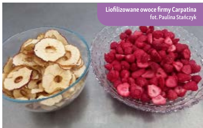
Liofilizowane owoce firmy Carpatina

Liofilizacja jest skutecznym sposobem konserwacji cenionym za swoją delikatność? W tym procesie woda jest usuwana z zamrożonego produktu poprzez sublimację lodu, co oznacza, że lód przechodzi bezpośrednio w parę wodną, pomijając fazę ciekłą. Cały proces odbywa się w niskiej temperaturze i przy obniżonym ciśnieniu, co sprawia, że jest to najbardziej oszczędna metoda konserwacji.