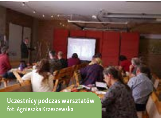
Uczestnicy podczas warsztatów