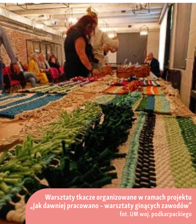
Warsztaty tkackie organizowane w ramach projektu „Jak dawniej pracowano – warsztaty ginących zawodów”

Inicjatywa „Jak dawniej pracowano” przedstawiała odbiorcom zanikające bogactwo kulturowe, pochodzące z tradycji ludowej. Miała przekazywać i utrzymywać tradycyjne wartości wśród mieszkańców gminy Zagórz. Obejmowała przede wszystkim zaangażowanie w zachowanie tradycji oraz promowanie znajomości zawodów, które w niewielkim stopniu są kultywowane współcześnie: tkactwo, wikliniarstwo czy ceramika. W warsztatach wzięło udział 100 osób.