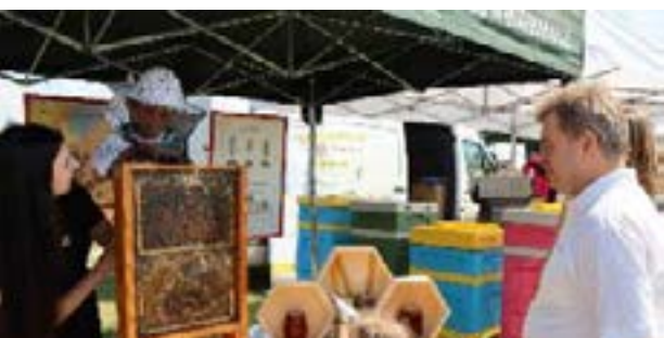
Warsztaty prowadzone w ramach operacji „Rolnictwo przyjazne środowisku na podkarpackich polach”

Zalety te sprawiają, że zrównoważone rolnictwo staje się coraz bardziej pożądanym modelem produkcji żywności, odpowiadając na współczesne wyzwania związane jednakowo z ochroną środowiska, jak i zapewnieniem zdrowej żywności dla społeczeństwa.