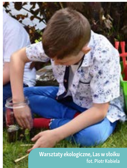
Warsztaty ekologiczne, Las w słoiku

Każdy z uczestników przygotował także zielony obraz ze zgromadzonych kamieni, roślin, patyków, zieloną instalację przy użyciu plastikowych odpadów czy zielony las w słoiku.