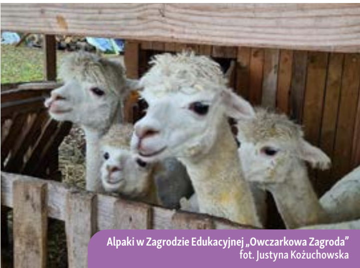
Alpaki w Zagrodzie Edukacyjnej „Owczarkowa Zagroda”