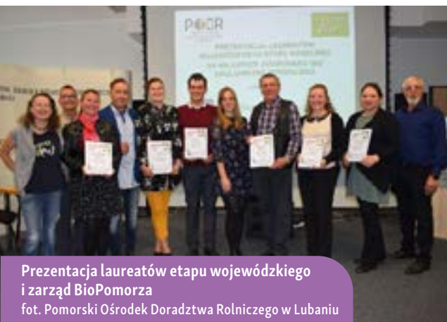
Prezentacja laureatów etapu wojewódzkiego i zarząd BioPomorza

W ostatnich latach świadomość znaczenia zrównoważonego rozwoju i ekologicznych metod produkcji żywności znacząco wzrosła. W odpowiedzi na te zmieniające się potrzeby i oczekiwania społeczne, zainicjowano innowacyjny projekt mający na celu zrewolucjonizowanie sektora rolnictwa ekologicznego. Ten ambitny program, skupiając się na współpracy i wymianie wiedzy między różnymi grupami zawodowymi – od producentów i przetwórców po doradców i specjalistów – dąży do stworzenia nowej jakości w rolnictwie ekologicznym. Operacja ta, charakteryzująca się dynamicznym podejściem do edukacji i współpracy, otwiera nowe horyzonty dla sektora rolniczego, podkreślając przy tym znaczenie innowacji i zrównoważonego rozwoju.