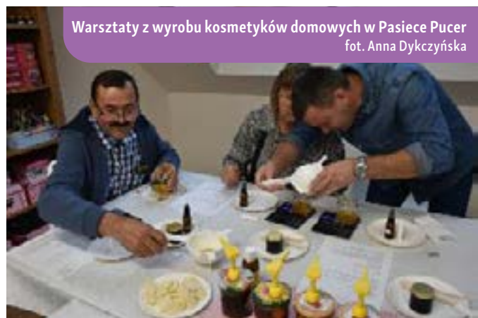
Warsztaty z wyrobu kosmetyków domowych w Pasiece Pucer

Apiterapia jest dziedziną medycyny alternatywnej. Koncentruje się przede wszystkim na leczeniu i profilaktyce różnych problemów zdrowotnych przy wykorzystaniu produktów pszczelich. Naturalne substancje takie jak miód, propolis, pyłek kwiatowy czy jad pszczoły, pełne są korzystnych właściwości zdrowotnych, co sprawia, że apiterapia zyskuje na popularności jako uzupełnienie konwencjonalnych metod leczenia.