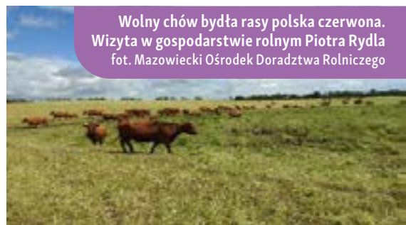
Wolny chów bydła rasy polska czerwona. Wizyta w gospodarstwie rolnym Piotra Rydla

Współpraca w ramach programu PROW poskutkowała wprowadzeniem nowej technologii w żywieniu zwierząt. Dzięki temu skrócono czas opasu bydła z 24 do 20-22 miesięcy. Operacja polegała na wprowadzeniu lepszych sposobów dbania o zdrowie zwierząt, ich karmienie i monitorowanie, co poprawiło efektywność